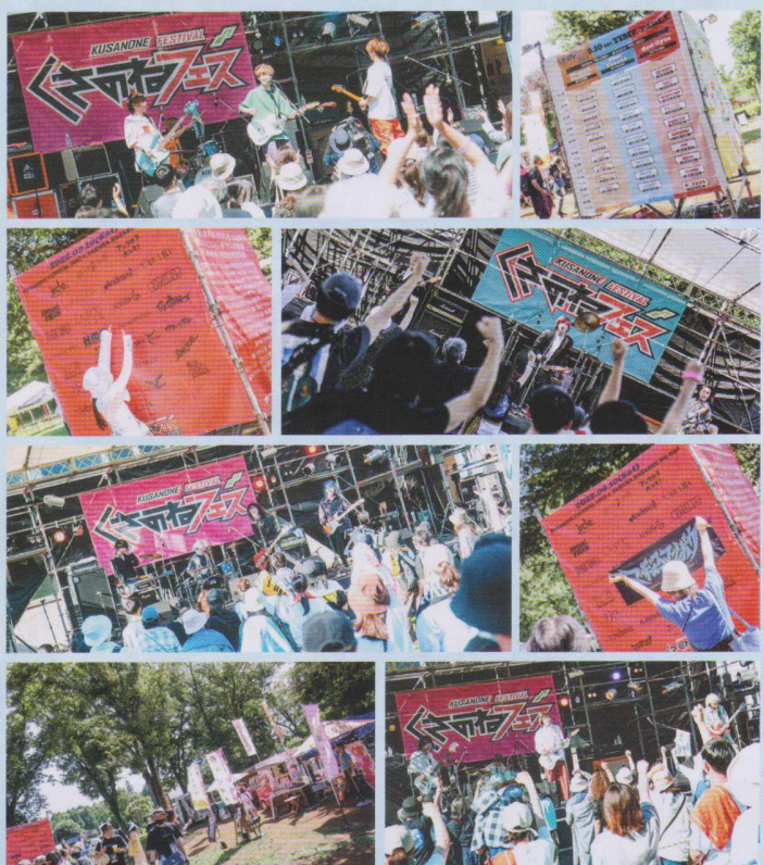
※くさのねフェスティバルの写真は昨年のものです

今年は、2023/9/9(土) 佐倉草ぶえの丘 800名の動員を目指し、出演者・関係者200名、4会場でライブ演奏する野外音楽イベントを企画してきましたが、残念ながら台風の影響により開催を断念しました。来年は総動員数1000名以上を目標に、若い実行委員の参加を促し更なる大きなムーブメントとなるよう運営を続けていきたいと思っています。