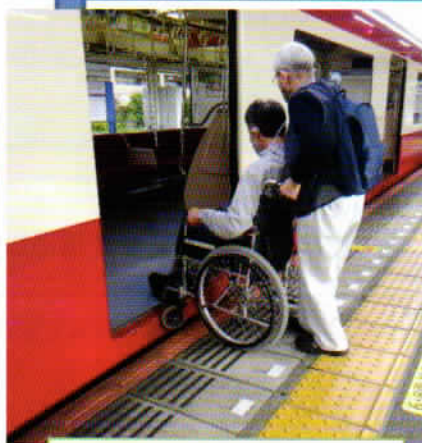
電車とホームの段差が...