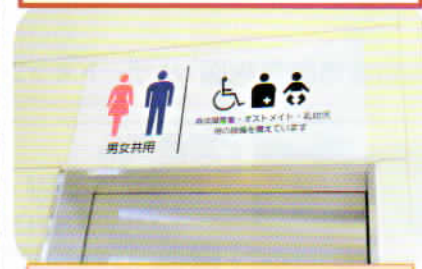
分りやすい駅の多目的トイレ