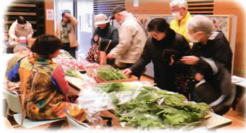
地元の新鮮野菜は早い者勝ち