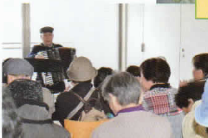
アコーディオンに歌声も響く!