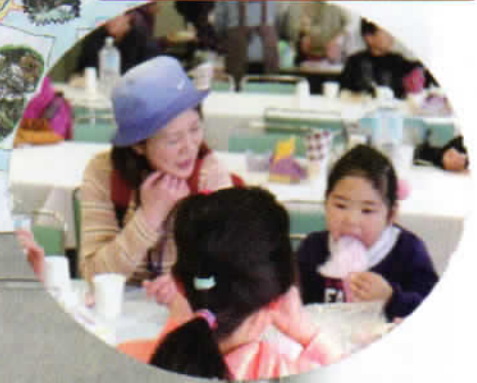
おいしい！ 軽食コーナーで