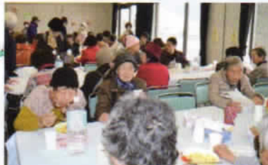
軽食コーナー、何食べる?