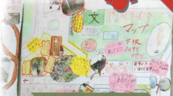
内郷小の児童が作成した【内郷地区安全マップ】