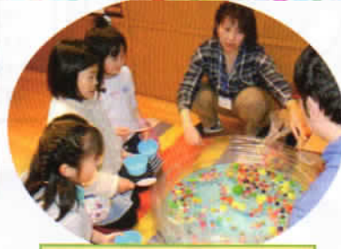
スーパーボールすくい