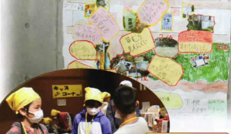
キッズコーナーではかわいい子供たちが大活躍