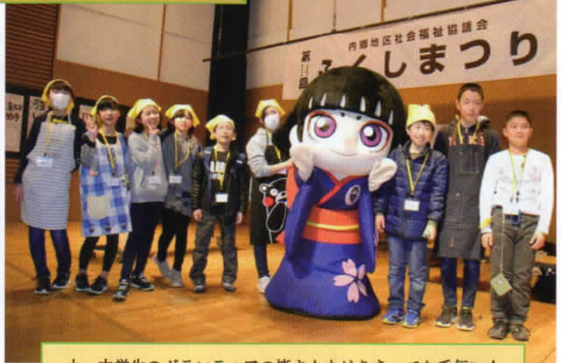
小・中学生のボランティアの皆さんもはりきってお手伝い!