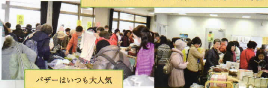
バザーはいつも大人気