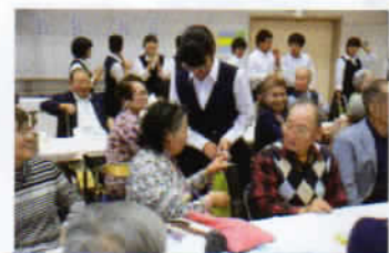
当選 おめでとうございます！！