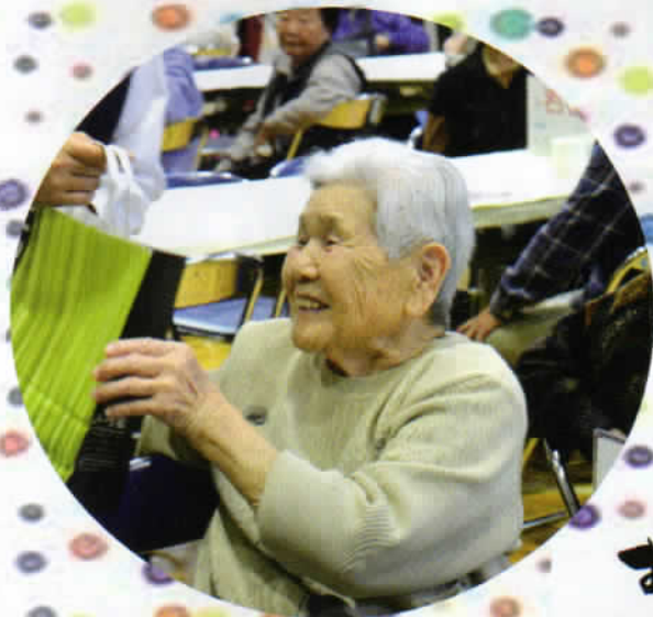
“当選”まあ、うれしい!