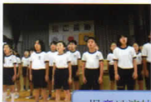
児童は演技でお祝い