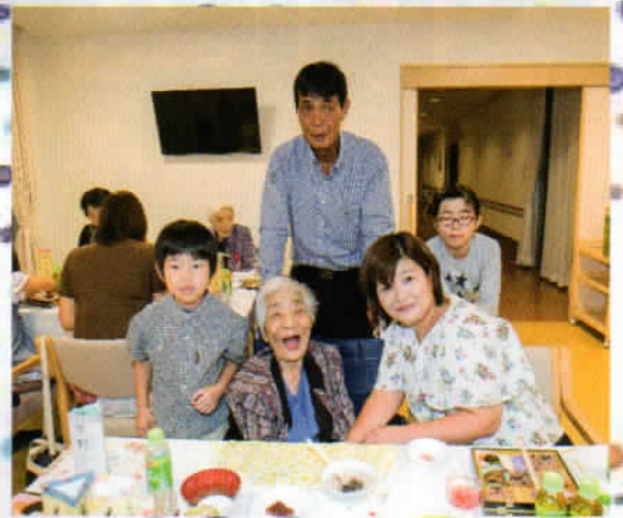
素敵な敬老のつどい!