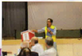
抽選会 誰に当たるかな？