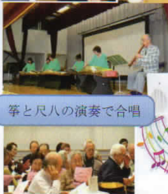
箏と尺八の演奏で合唱