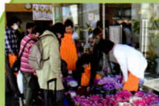
心を込めて作りました