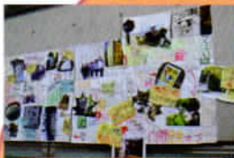
小学生の作った 安全マップ