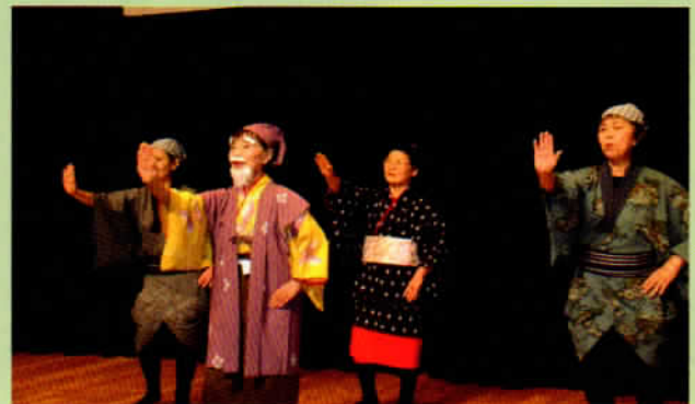
ホールでは色々な催しに拍手!