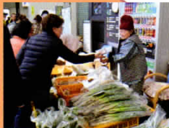
新鮮野菜は大人気！