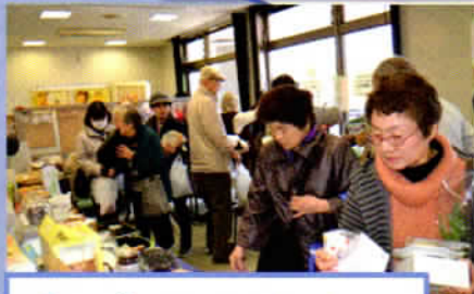
欲しい物は見つかりましたか？