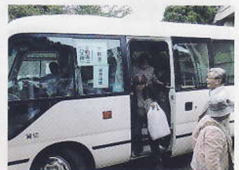
会場にはバスで到着