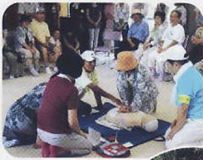
AEDの実施訓練 指導員から懇切 丁寧に。

宮前ロースタウン自治会防災訓練 残暑厳しい9月9日、ロースタウン自治会の防 災訓練が行われました。自治会員の防災に対する 意識は高く、全世帯の83%の家庭が参加されまし た。