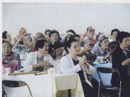
児童の演技に拍手