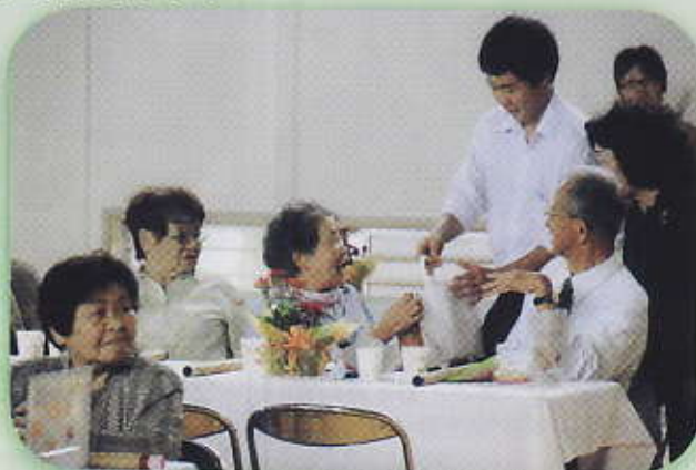
賞品があたり思わず笑顔が

本年度の敬老のつどいは 9月29日(土)に内郷小体 育館で開催されました。式 典に続き、内郷小児童によ る合唱・踊り、笑踊会の皆 さんによるばか面おどりと 寸劇を楽しみました。 参加者の方からは、交流 の場が少なくなつた今日、 昔馴染みと会う良い機会と なつたとのこと意見もありま した。