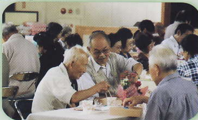
旧交を温め会話もはずむ