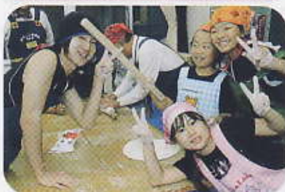
うどん作りでVサイン

内郷小の通学合宿は、10月14日から19日までの5泊6日の日程で行われ、地区社協として、14日の昼食と18日の夕食作りのほか、ミニゲームの指導に参加協力しました。また、スクールガードボランティアの皆さんと共に児童の買い物付添いに同行しました。閉校式では、地域協力者として児童・カウンセラー一同から感謝状をいただきました。