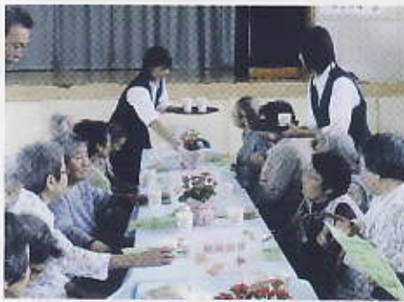
中学生からお茶の接待を