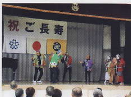
笑踊会の皆さんのばか面踊り