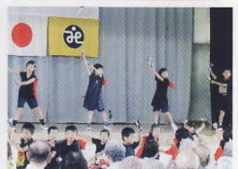
1・2年生の獅子の舞いの踊り