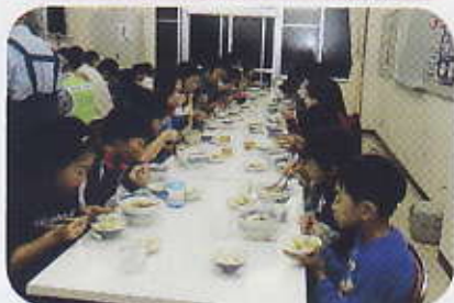
自分たちで作ったうどんの味は格別