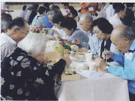
昼食はいかがでしたか