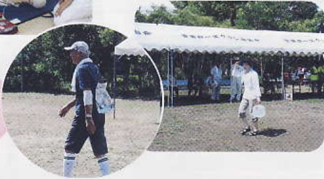
災害時の水の搬 送。けっこう重 たいですね。