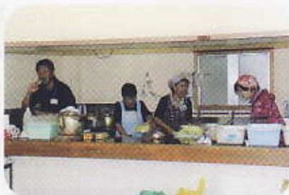
福祉委員の皆さんも厨房で活躍