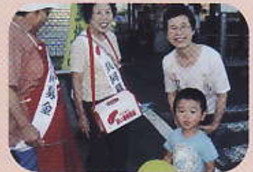
トウス京成佐倉店前で