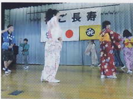
5・6年生は佐倉音頭を