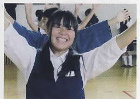
中学生も児童の輪の中に