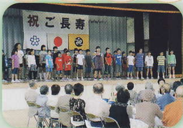
内郷小児童の合唱