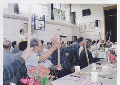
食後は瞬発力のテストに挑戦