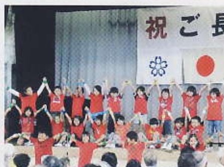
3・4年生はカルナヴァルを踊る