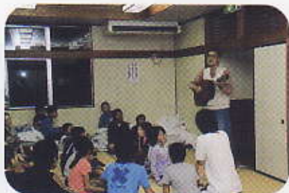
夕食前のミニゲーム指導