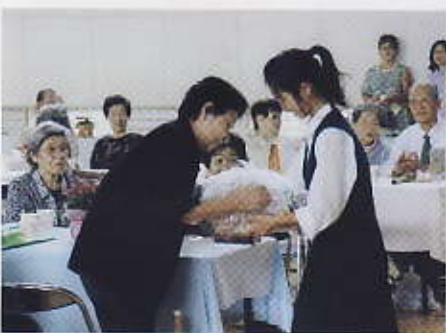
一等当選おめでとうございます