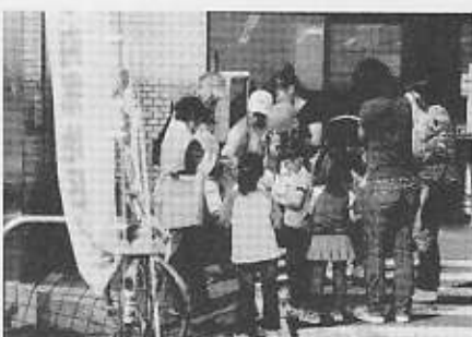
共同募金スナップ