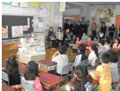
保護者参加の授業