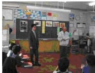
ゲストティーチャーを招いての授業