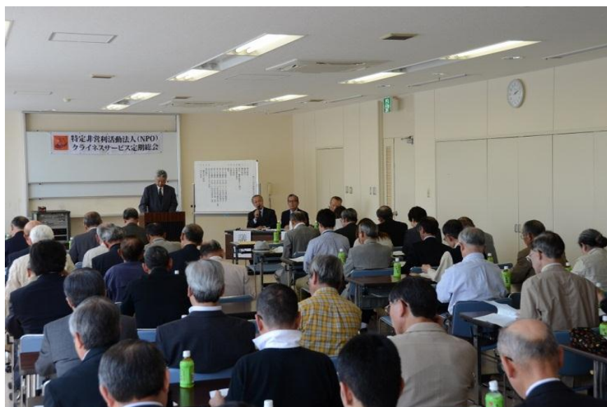
5月13日(日)志津コミセンでは、佐倉市長をはじめ警察署・消防署、学校、地域自治会 などからの来賓を含め約80名の出席を得て第13回定期総会が開催されました。