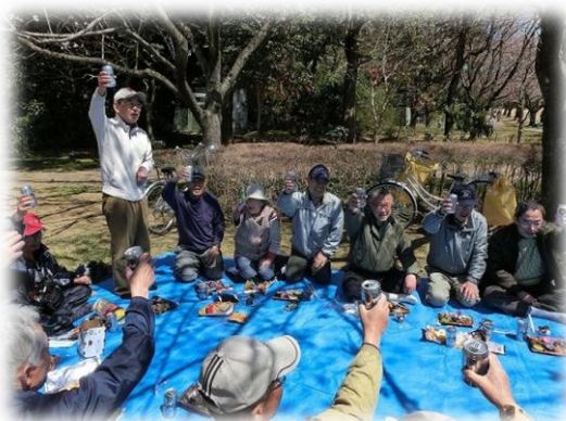
4月10日晴天のもと、今年は上座公園で開かれた恒例の「花見会」。 出席者の会費1000円と、さらに有志からの各種 差し入れもあり、話はずんで懇親深まる。