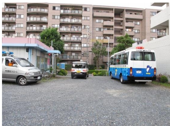
毎月佐倉警察署「移動交番」車が来所し、 合同によるパトロールが実施される。