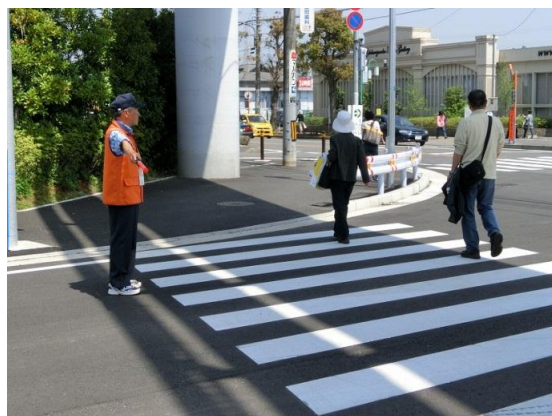
4月29日、イオン平面駐車場の代わりに「街ギャラリー」前のスペースで開催 されたユーカリ地区恒例の「緑のまつり」では場内整理のほか、3月21日開通した 新道から来場する車や、横断歩道を渡る歩行者の誘導も担当した。