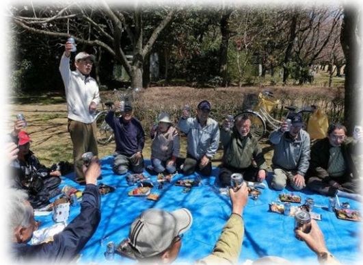
4月10日晴天のもと、今年は上座公園で開かれた恒例の「花見会」。 出席者の会費1000円と、さらに有志からの各種 差し入れもあり、話はずんで懇親深まる。