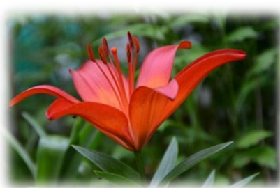
ユリにもいろんな → 色が