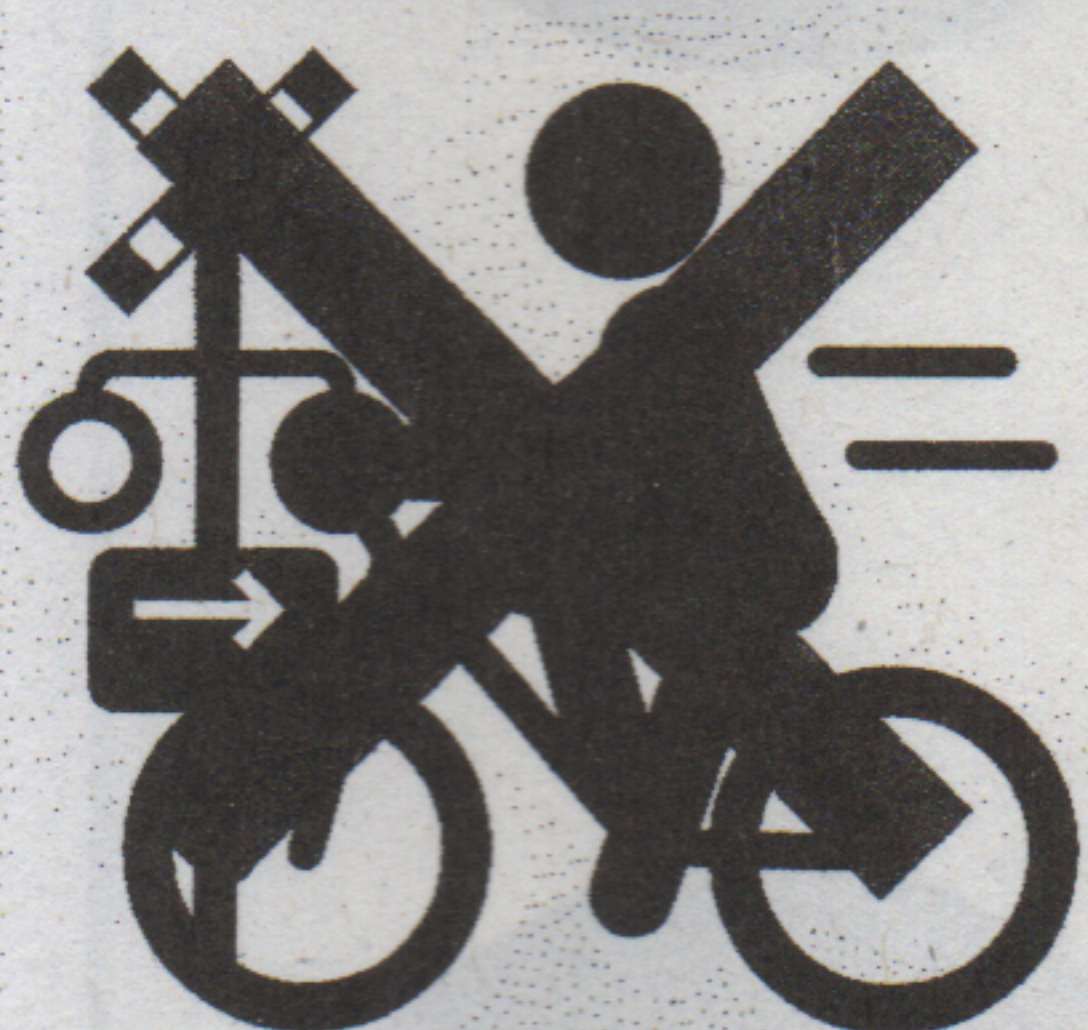
遮断踏切立入り【反則金 7,000 円】