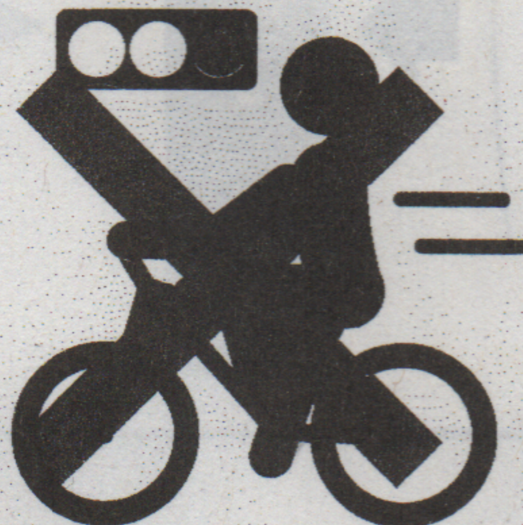
信号無視【反則金 6,000 円】