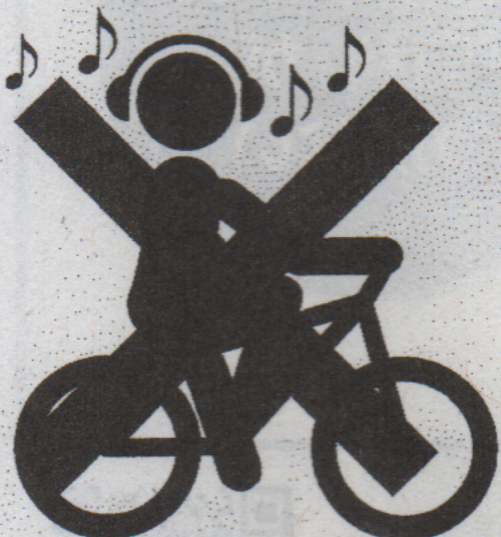
ヘッドホン(イヤホン)【反則金 5,000 円】 ※音量を上げ音楽を聴く等、安全な運転に必要な音声が聞こえないような状態にすること。