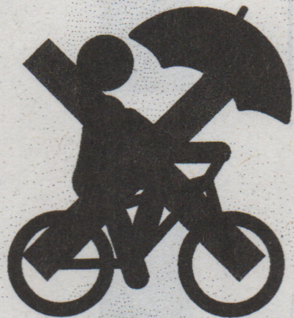
傘さし運転【反則金 5,000 円】