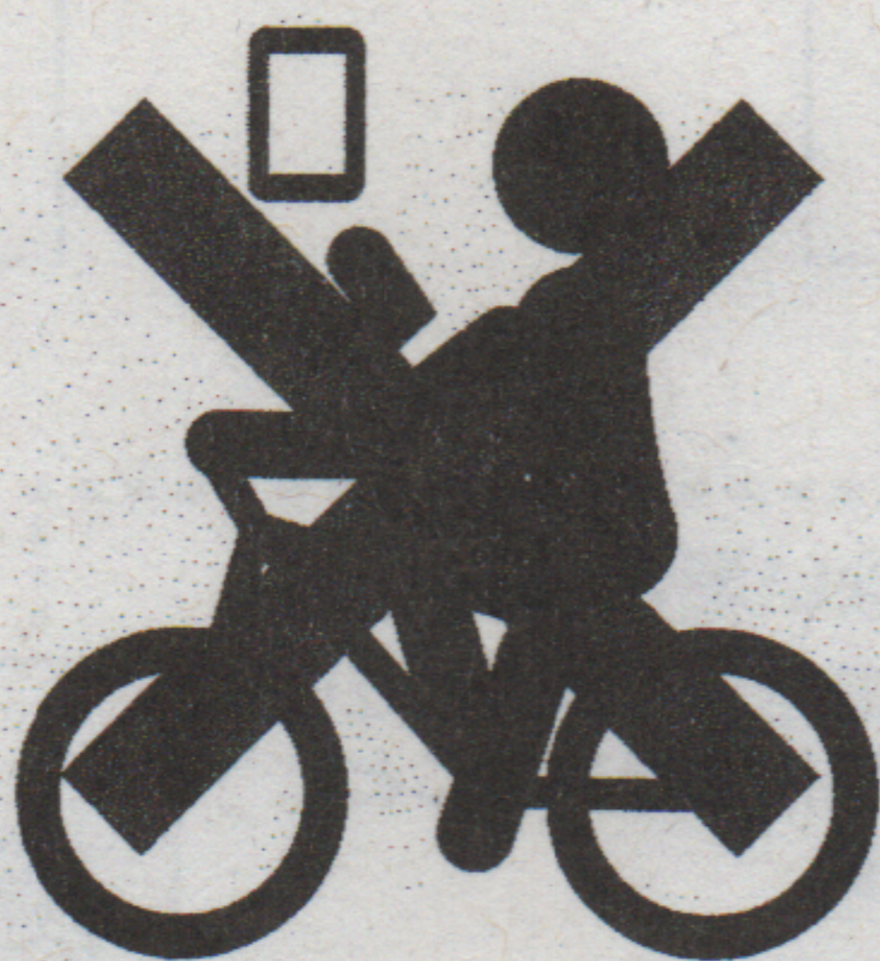
ながらスマホ【反則金 12,000 円】 (保持)