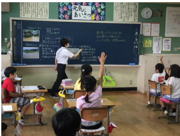
4年 大雨や洪水からの身の守り方を学ぼう