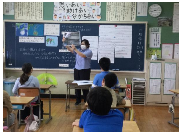
5年 台風に備えてできることは？